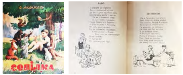
Рис. 2. Володимир Ладижець. Сопілка (The Reed Pipe)