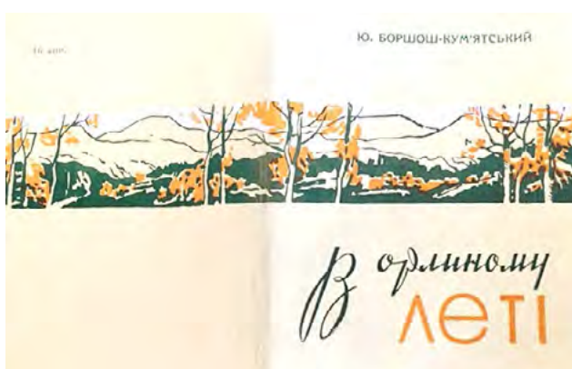
Рис. 8. Юрій Боршош-Кум'ятський. В орлиному леті (In an Eagle's Flight)