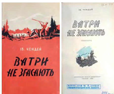
Рис. 7. Іван Чендей. Ватри не згасають (The Campfires Never Fade)