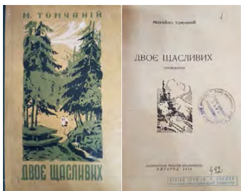
Рис. 6. Михайло Томчаній. Двоє щасливих (Two Happy Ones)