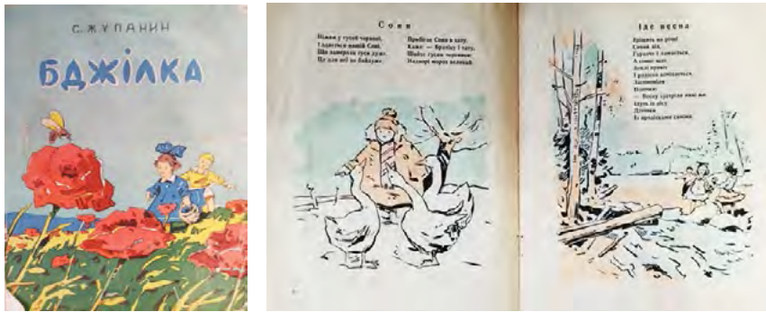
Рис. 3. Степан Жупанин. Бджілка (The Little Bee)