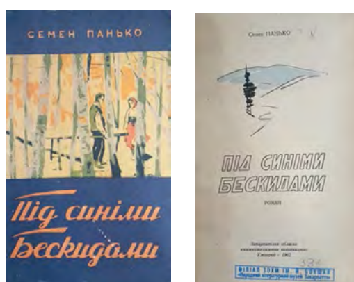
Рис. 9. Семен Панько. Під синіми Бескидами (Beneath the Blue Beskids)