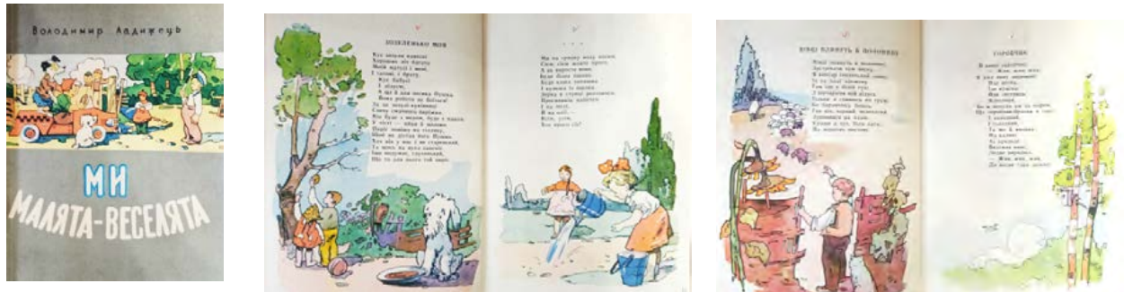
Рис. 4. Володимир Ладижець. Ми малята-веселята (We Are Cheerful Kids)