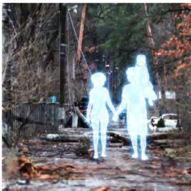
Рис. 5. Кадр із анімаційного фільму «Душі»