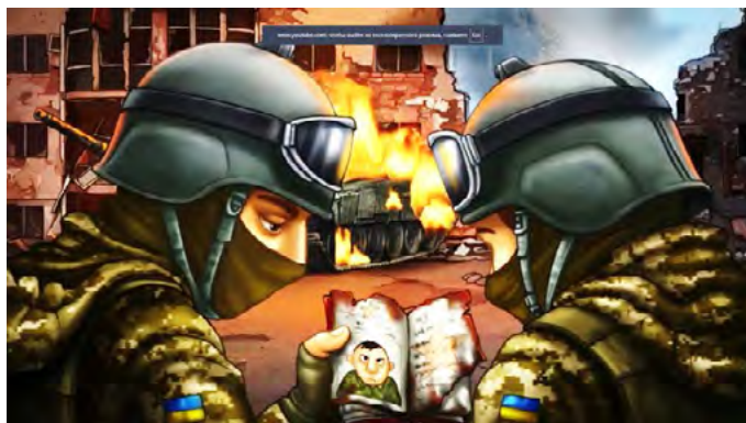
Рис. 6. Кадр із анімаційного фільму «Життя та смерть»

й символічна категорія. Анімаційна мова дозволяє показати, що війна руйнує звичний порядок речей, перетворюючи буденність на простір постійної загрози. Водночас образи життя (світло, рух, тепло) протиставляються смерті, яка зображується через темряву, застиглість і руйнацію. Цей твір можна розглядати як цифровий меморіал, що фіксує індивідуальні та колективні переживання. Він виконує функцію свідчення, адже транслює досвід війни у формі, зрозумілій для широкої аудиторії, і водночас стає частиною культурної пам'яті (рис. 6) [15].