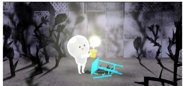
Рис. 4. Кадр із анімаційного фільму «Війна що змінила Рондо»

Романи та Андрія Лопати – «Війна що змінила Рондо» Олександра Даниленка. У центрі сюжету знаходиться місто Рондо, яке живе у світлі та гармонії, доки його не охоплює війна. Персонажами виступають світлові істоти, які змушені протистояти темряві, що символізує руйнівну силу війни, війна постає у вигляді «темної хмари». Метафорична мова твору дозволяє уникнути прямої репрезентації насильства, але водночас передати відчуття страху, втрати та необхідності єдності.