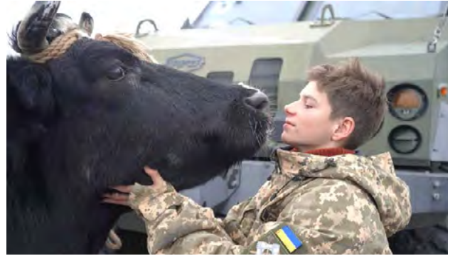
Рис. 3. Кадр із фільму «Війна очима тварин»

Прикладом того, як дитяча анімація може транслювати травматичний досвід війни у формі, доступній для дітей та молоді, водночас формуючи культурну пам'ять і постпам'ять, є анімаційна стрічка, створена за мотивами однойменної книги братів