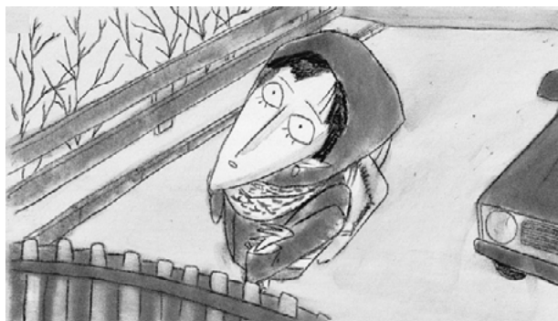
Рис. 1. Кадр із анімаційного фільму «Я померла в Ірпені»

в Ірпені » режисерки Анастасії Фалілеєвої демонструє, як індивідуальний досвід війни трансформується у художню форму, де смерть і пам'ять переплітаються у метафоричній візуальності. Анімація реконструює досвід евакуації з Ірпеня на початку вторгнення. Використання монохромної мальованої техніки створює ефект фрагментарної пам'яті [13]. Робота отримала міжнародне визнання, зокрема нагороду в Клермон-Феррані, що підтверджує її значущість як свідчення минулого.