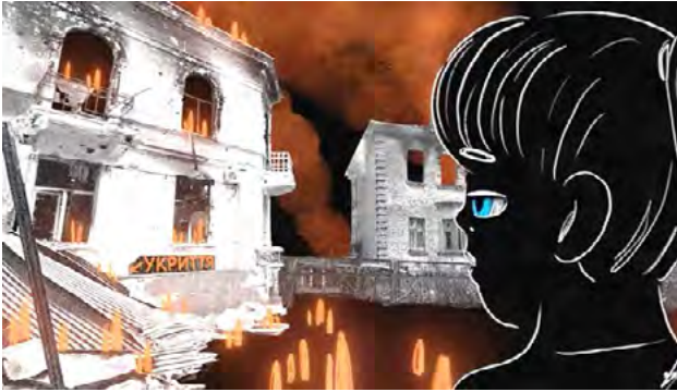
Рис. 2. Кадр із анімаційного фільму «Маріуполь. Сто ночей»

а й свідченням, яке зберігає пам'ять про події для наступних поколінь [14].