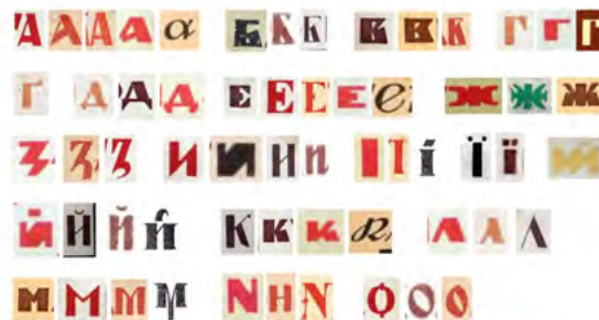
Рис. 4. Найбільш характерні літери Лесья Лозовського (порівняльна таблиця А. Сердюк)