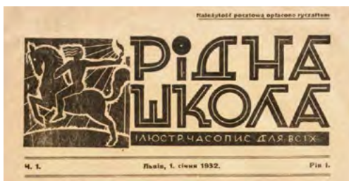
Рис. 11. Святослав Гординський. Літерація для часопису «Рідна школа»