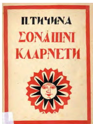
Рис. 2. Лесь Лозовський, обкладинка до «Сонячних кларнетів» Павла Тичини