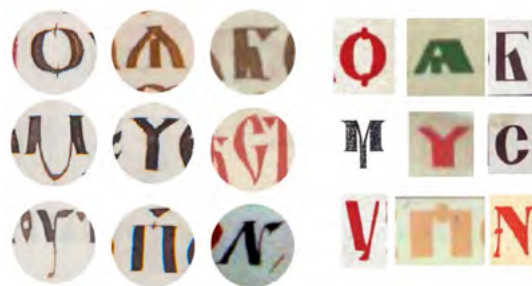
Рис. 5. Порівняльна таблиця Пересопницького Євангелія (1556–1561 рр.) та літер Лесья Лозовського