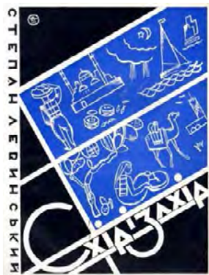
Рис. 1. Святослав Гординський. Обкладинка книги «З розмов з Гофмансталем», обкладинка книги «Схід і захід»

квадратний модуль, більшість літер мають високий контраст та жирне накреслення. Літери О, М, Ч, Я, Б дуже подібні на літери з Пересопницького Євангелія, визначної рукописної пам'ятки староукраїнської мови та мистецтва XVI століття (Рис. 5). На цьому етапі процес аналізу, який безумовно є фундаментом шрифтового проєкту, зупиняється і починається авторська робота над шрифтом як системою. В процесі роботи, студентка повертається до робіт художника, оскільки іноді в процесі, особливо фіналізації проєкту, можна втратити автентичний характер задуму. Студенткою були збережені неповторні графемі літер З, С, Ц, Ч, Ж, літери И, Н та Й із масивною діагоналлю. Наступним етапом відбувся процес пошуку графем (рис. 6). Представлені ескізи відображають різні варіанти графем до букв Б, О та Н, із яких були обрані лише деякі для подальшого опрацювання [11, с. 39].