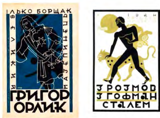
Рис. 12. Роботи Святослава Гординського: обкладинка твору «Великий мазепинець Григор Орлик»; обкладинка книги «З розмов з Гофмансталем»

(x-height), висоту верхніх виносних елементів (ascender height) та висоту нижніх виносних елементів (descender height). Вони більш різноманітні за своїми пропорціями та часто мають більш складну структуру, яка включає верхні виносні елементи (наприклад, "b", "d", "p", "q"). Співвідношення між висотою літер (x-height), 39 висотою верхніх та нижніх виносних елементів, а також висотою прописних літер має бути збалансованим. Це впливає на загальний вигляд та читабельність тексту. Далі йшла робота з прописними літерами – маюскулом. На прикладі маюскульних літер можна зазначити, що шрифт складається з модульних елементів, завдяки яким можна побудувати інші літери. Це стосується також і мінускулів. В латинській абетці, завдяки літері «n» можна побудувати «h», «m» та «u», на базі «b» будуються «d», «p» та «q», спільну побудову також мають «i» та «j». Також в кириличній абетці літери «е» та «є» будуються на базі «с», «ж» фактично є двома літерами «к», а літера «ц» має спільну будову з «ш» та «щ» (Рис. 13).