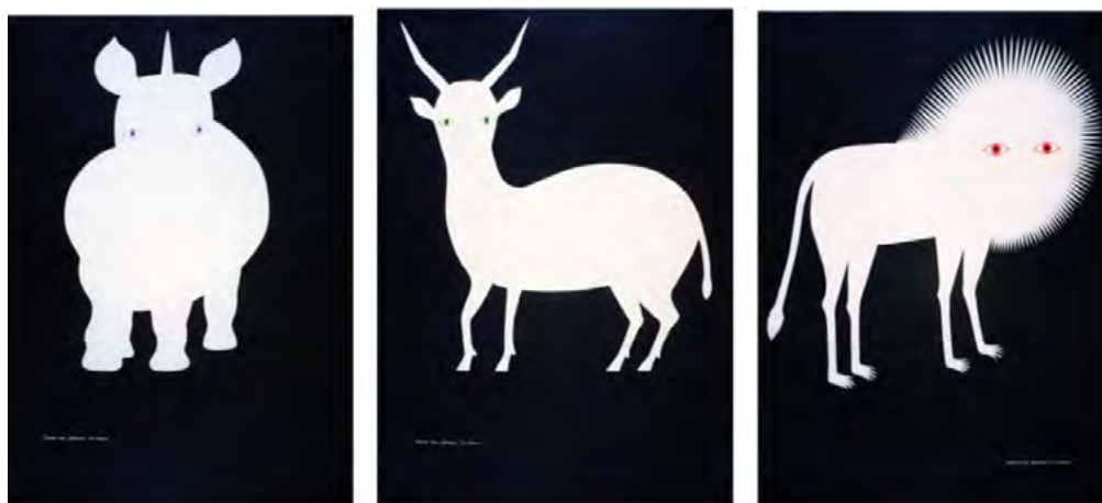
Рис. 2. Казумаса Нагаї. Японія. 1997 р. Серія плакатів «SAVE ME, PLEASE. I'M HERE». Музей екологічного плакату «4-й Блок» ХДАДМ. Україна