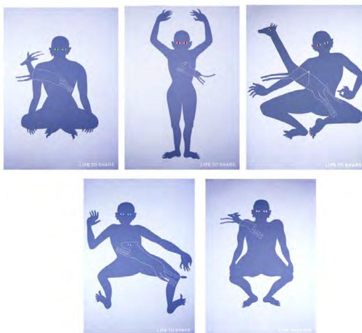
Рис. 3. Казумаса Нагаї. Японія. 2000 р. Серія плакатів «LIFE TO SHARE». Музей екологічного плакату «4-й Блок» ХДАДМ. Україна