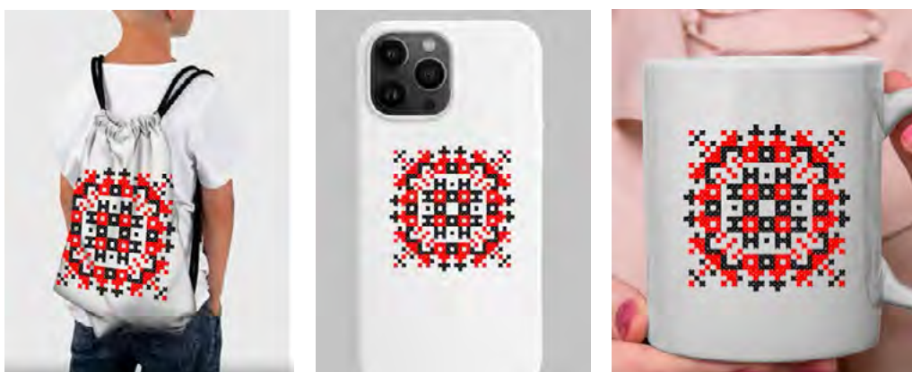
Рис. 2. Візуалізація створеного орнаменту та його презентація на мокапах

Завдяки поєднанню традиційних і цифрових технологій студенти здобувають практичні навички проектування, розвивають креативне мислення та здатність до культурної репрезентації, що є важливим аспектом формування професійних компетентностей у галузі декоративно-прикладного мистецтва та графічного дизайну.