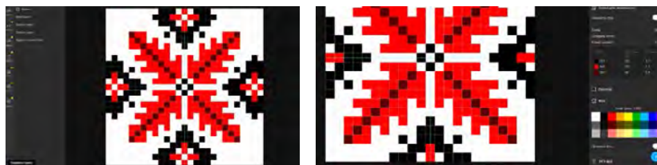
Рис. 3. Технологічний процес створення орнаменту та цифрова інтерпретація етнокультурних мотивів