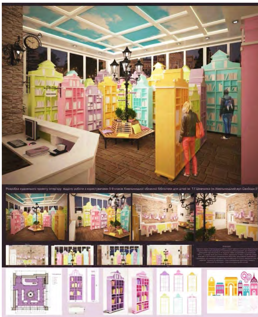
Рис. 7. Дизайн-проект бібліотеки: образно-концептуальне рішення «Старе місто» (м. Хмельницький). Автор дизайн-проекту: Лучкова Р.

ного підходу у формуванні інтер'єру сучасної бібліотеки.