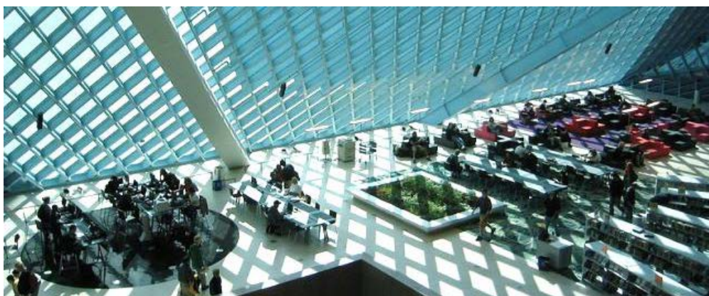
Рис. 5. Інтер'єр Центральної бібліотеки Сієтла: інноваційна організація простору та складна геометрія (Сієтл, США)