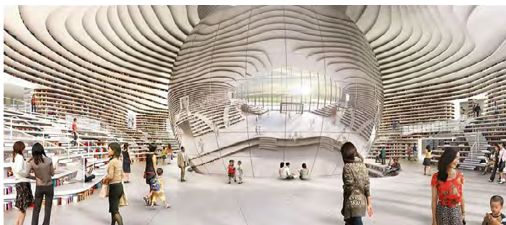
Рис. 3. Інтер'єр бібліотеки Tianjin Binhai: пластика форм та організація багаторівневого простору (Тяньцзінь, Китай)

Інтер'єр бібліотеки Tianjin Binhai (Китай) вирізняється виразною образно-концептуальною ідеєю, заснованою на використанні хвилястих форм, що формують як просторову структуру, так і книжкові полиці. Простір організовано як єдину безперервну систему з плавними переходами архітектурних елементів, що створює ефект динамічного середовища. Центральним композиційним елементом є сферичний атриум, навколо якого вибудовується багаторівнева структура інтер'єру [11]. Такий підхід підсилює візуальну виразність і емоційне сприйняття простору, формуючи унікальну ідентичність бібліотеки та демонструючи інтеграцію