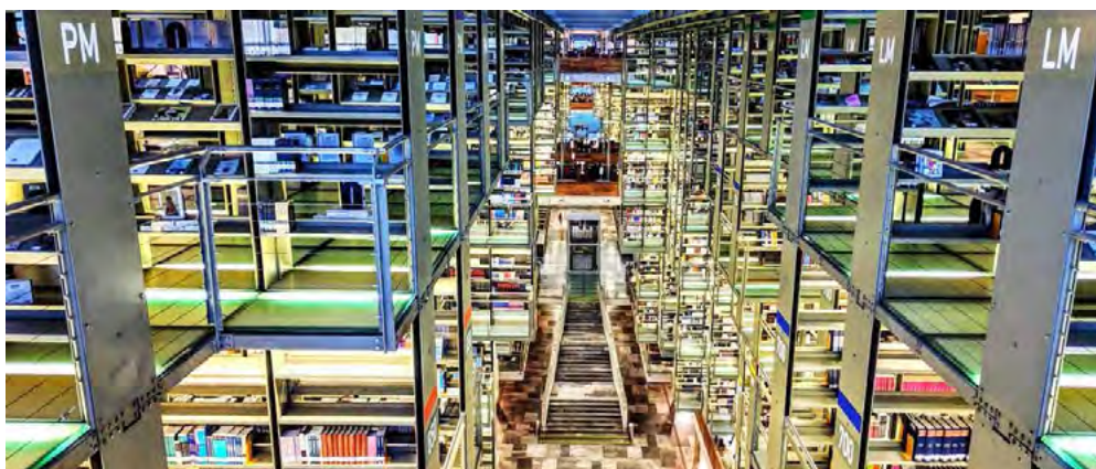
Рис. 4. Інтер'єр бібліотеки Biblioteca Vasconcelos : підвісні конструкції та вертикальна організація простору (Мехіко, Мексика)

Інтер'єр бібліотеки Deichman Bjørvika (Осло, Норвегія) вирізняється відкритістю, багаторівневістю та прозорістю просторової організації. Основу композиції становить центральний атриум, який забезпечує візуальні зв'язки між поверхами та рівномірне