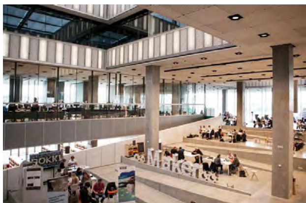
Рис. 2. Інтер'єр бібліотеки Dokk1: відкритість простору та організація соціально-комунікативних зон (Орхус, Данія)

залученню різних вікових груп [10]. Інтеграція ігрових і навчальних функцій підсилює пізнавальну активність користувачів, що дозволяє розглядати бібліотеку як адаптивну платформу для соціальної взаємодії та колективної діяльності (рис. 2).