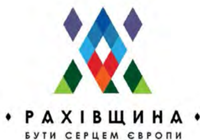
Рис. 4. Логотип Рахівщини, брендбук Рахівського району, 2018 рік

На основі стилізованих орнаментальних мотивів гуцульських килимів розроблена система візуальної комунікації бренду, яка використовується в різних середовищах і носіях. Таким чином, айдентика Рахівщини поєднує традиційні орнаментальні форми з сучасною графічною мовою, формуючи цілісний і впізнаваний образ регіону.