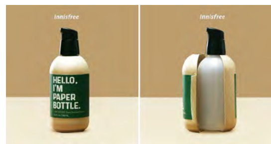
Рис. 1. Пакування сироватки Innisfree: пластикова пляшка, прихована під паперовим шаром [12]

У контексті графічного дизайну грінвошинг постає як інструмент маніпулятивного формування візуального іміджу, де екологічність продукту лише імітується через естетичні рішення. Яскравим прикладом такої стратегії є кейс бренду Innisfree: використання природних мотивів, «зеленої» стилістики та неоднозначного маркування «Hello, I'm Paper Bottle» створило враження цілковитої натуральності (рис. 1).