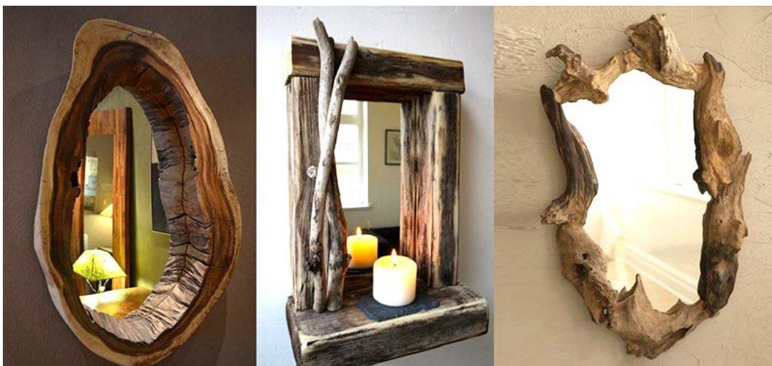
Рис. 6. Зразки втіленні сучасних дизайнерських рішень з використанням природніх форм деревини

Перспективним в цьому напрямі є, також, розвиток технології прозорого дерева, яка передбачає спеціальну обробку клітинної структури деревин з подальшим заповненням її полімером. В результаті матеріал частково зберігає природню форму, текстуру деревини, але набуває світлопроникності. Це відкриває нові можливості для створення декоративних перегородок, світлових панелей, інтер'єрних інсталяцій та інш.