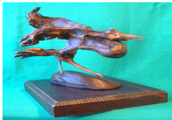
Рис. 3. Скульптура птаха (лісова скульптура)