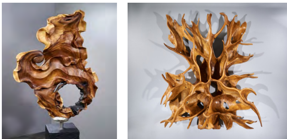
Рис. 7. Зразки абстрактних інтер'єрних об'єктів з первозданих форм деревини

Яскравим прикладом цього є книжкова полиця з натурального дерева (рис.9), яка імітує гіллясту структуру дерева, що виглядає органічним елементом інтер'єру. Так, дизайнерські об'єкти створені фірмою SpryInterior демонструють, як гілки дерева можна перетворити на функціональне мистецтво, яке збагачує повсякденне життя. Її продукція показує, як продуманий дизайн може