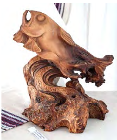
Рис. 4. Скульптура риби

У дизайн-просторі ХХІ століття вироби з первозданних форм деревини набувають нового змістового та функціонального наповнення. Художники і дизайнери все частіше прагнуть не до досконалості обробки матеріалу, а намагаються виставити на показ декоративність вад деревини й незвичні ракурси бачення природної краси форм і текстури цього матеріалу. У добу стандартизованого виробництва та типовості дизайнерських рішень така ексклюзивність набуває особливої цінності – як естетичної, так і світоглядної.