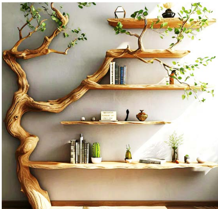
Рис. 9. Книжкова полиця з натурального дерева, яка імітує гіллясту структуру дерева

допомогти нам жити більш змістовним та натхненним життям, відчуваючи внутрішній зв'язок з природою [6].