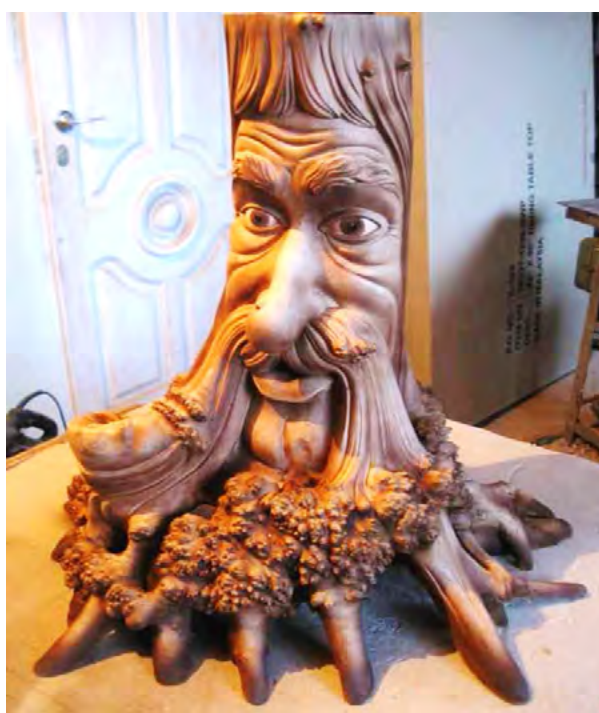
Рис. 5. Скульптура лісового духа