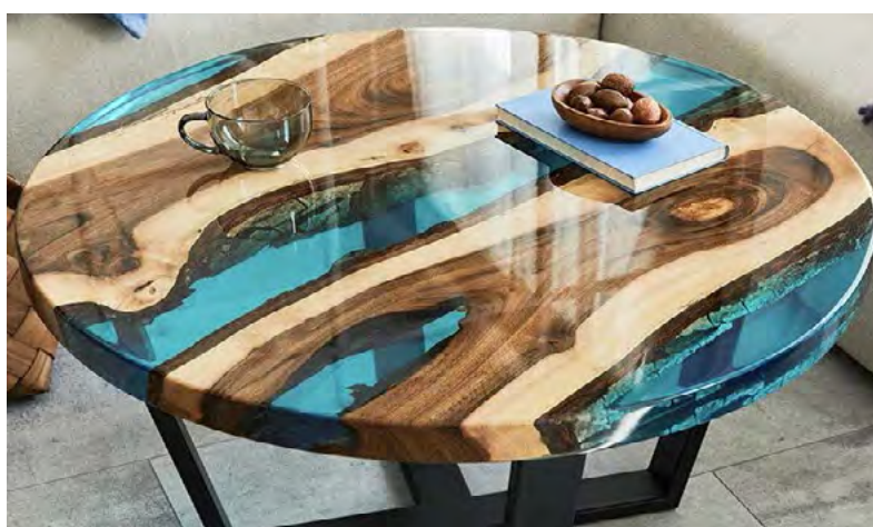
Рис. 8. Стіл виготовлений з розрізаного стовбура дерева, з вадою, залитого забарвленою епоксидною смолою