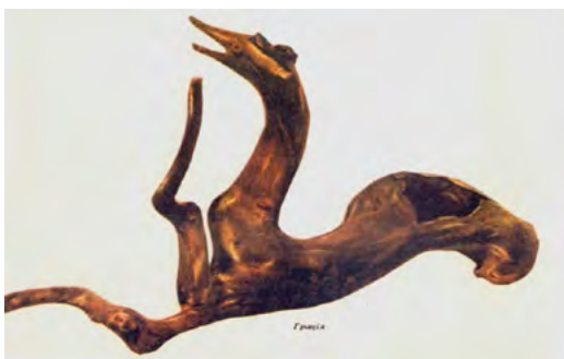
Рис. 2. Скульптура фантастичного звіра (лісова скульптура)