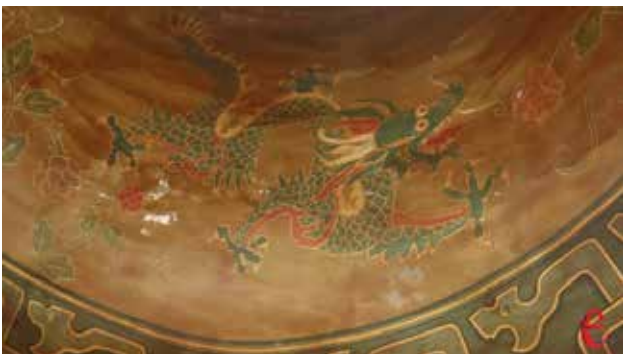
Рис. 6. Дракон. Інтер'єр Японської кімнати. Палацово-парковий ансамбль Самчики. Хмельниччина, Україна [24]

фельдшерсько-акушерського пункту та клубу [20, с. 45–51; 11, с. 125]. Після 1918 р. садиба в Самчиках змінила кількох власників, а з 1922 р. територію та садибні споруди зайняв місцевий радгосп. Палац зазнав