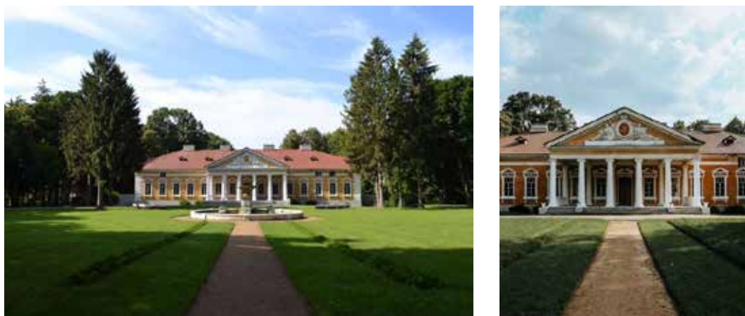
Рис. 2. Садиба Чечелів у Самчиках. Загальний вигляд [7]

Просторова організація приміщень дозволяла плавно переходити із зали до зали та прямувати далі у парк, звідки через дерев'яний міст відкривався вихід до річки. Архітектурне вирішення внутрішніх приміщень гармоніює зі стилістикою класицистичних фасадів. Центральною композиційною домінантою є ротондальний бальний зал з іонічними колонами по периметру, над яким здіймається кесонований дерев'яний купол із плафоном, що зображує небесне склепіння.