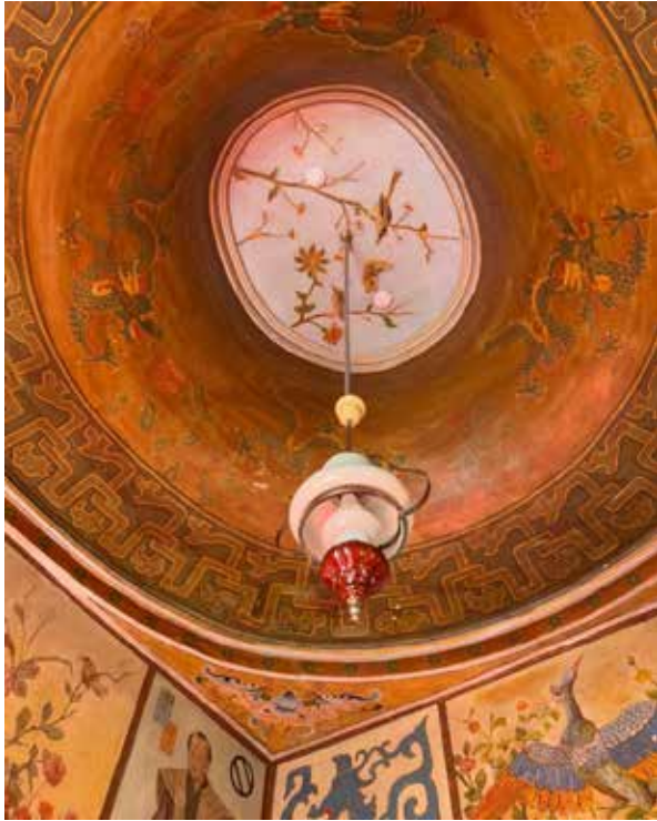
Рис. 5. Розписи стелі. Інтер'єр Японської кімнати. Палацово-парковий ансамбль Самчики. Хмельниччина, Україна.