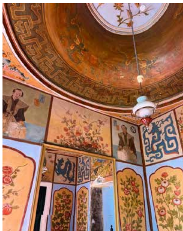
Рис. 4. Японська кімната. Загальний вигляд. Палацово-парковий ансамбль Самчики. Хмельниччина, Україна.

Метелики, які також наявні в розписах, символізують порятунок життя 24-го імператора Японії, який врятувався завдяки знищенню джмеля. Під куполом кімнати розташовано чотирипалого дракона, оскільки право зображати п'ятипалого дракона в золотому кольорі