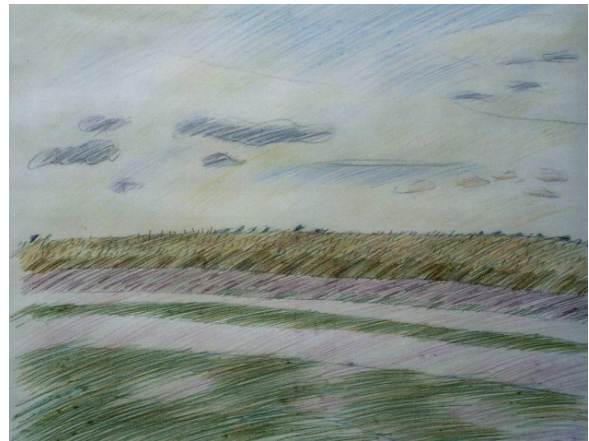
Рис. 6. Вергун Н. Хлібне поле. 1986

Протягом 1983–1986 р. мисткиня створює низку рисунків, у яких розвиває тему розробки композиції не за класичними канонами, а за власними художньо-естетичними потребами та відображає рух до примітивізму. Репрезентативним є рисунок «Хлібне поле» (Рис. 6), в якому аркуш розділений лінією небосхилу майже посередині. Горизонтальний ритм, якому підпорядкований увесь композиційний стрій роботи, урівноважується нерегулярним розташуванням хмар.