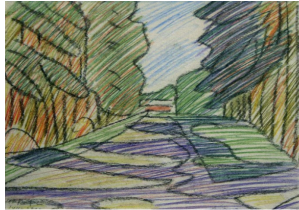
Рис. 7. Вергун Н. Дорога в лісі. 2000

нагадує пейзаж А. Матісса «Корсиканський пейзаж. Оливи» – блідо-фіолетові тіні дерев перетинають звивисту дорогу, що спрямована вдалину, плями світла м'якого жовтого і салатого кольору немов віддруковані на траві і дорозі. Композиція рисунку розгортається всередину та вгору, спрямованість підкреслена ритмом, що повторюється з двох боків у прорисовці контурів дерев.