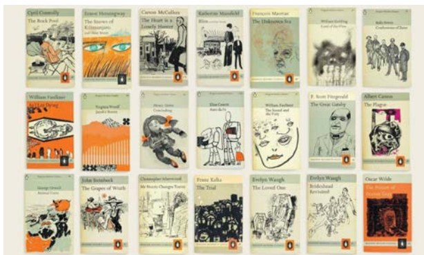
Рис. 1. Обкладинки серії книг видавництва “Penguin Modern Classics”

абстрактні прийоми. Один з найяскравіших представників – це книжкове видавництво “Penguin Modern Classics”. Дизайн книг Британського видавництва відрізняються абстрактними зображеннями серед конкурентів (рис. 1). Вони передають загальну атмосферу та тему книги без заглиблення у конкретні елементи сюжету.