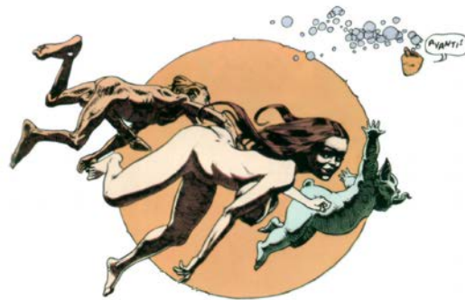
Іл. 1. Фрагменти «Le Bandard Fou» [6]