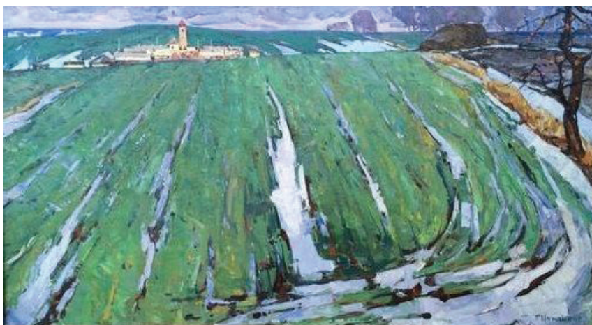
Іл. 3. Г. Чернявський «Ранній сніг». 1979. Полотно, олія. 60 x 110

Порівняти вище охарактеризовану картину ми можемо з роботою більш раннього періоду – «Літо» (іл. 4). Робота також була виконана в монохромній гамі, проте в теплому колориті. Використані більш ніжні кольори. Композиція побудована на ритмах стовбурів дерев та великих плямах їх крони, що займають більшу частину простору картинної площини. За допомогою цього засобу майстер відобразив масштаб дерев в станковому творі.