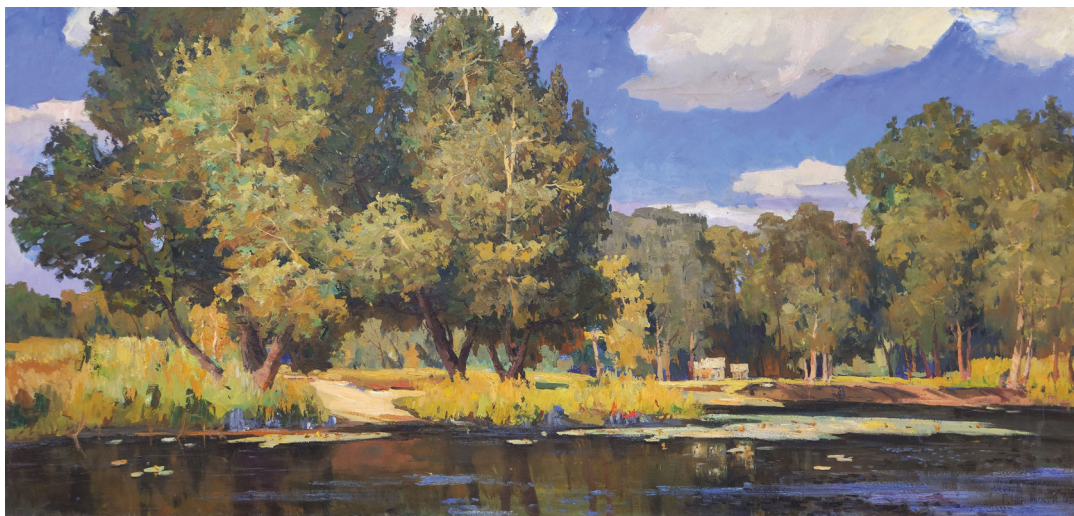
Іл. 2. Г. Чернявський «Навесні». 1963. Полотно, олія. 120 x 250 см

В пейзажі 1979 року «Ранній сніг» (іл. 3) ми можемо бачити використання переважно зеленого кольору з незначними додаваннями інших. Цей художній твір виконаний майже в «монокольорі» це – свідчить про високий ступінь майстерності митця та відання переваги до методів і засобів застосування у класичній школі живопису. Що тяжіє до традиції ведення роботи над картиною з використанням обмеженої палітри. Що передбачає використання майстрами якомога меншої кількості фарб. Важливо зауважити, що композиційне рішення цього живописного твору побудоване на ритмічних частинах, на великих плямах та на вивірених контрастах.