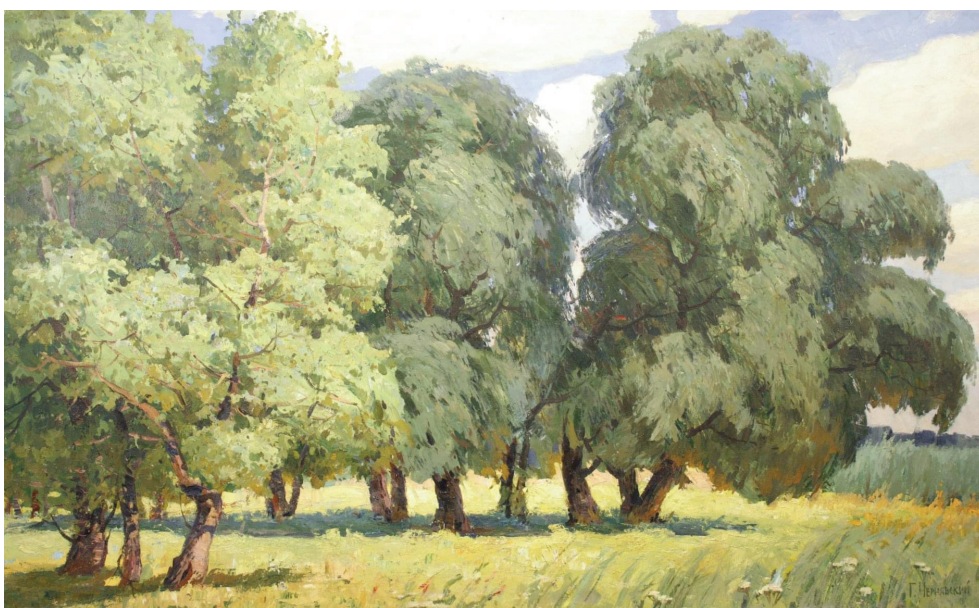
Іл. 4. Г. Чернявський «Літо». 1961. Полотно, олія. 120 x 195 см

«Творчий спадок Георгія Чернявського – це вагомий внесок у розвиток українського образотворчого мистецтва» [2]. Митець вправно експериментував у пейзажному жанрі за допомогою правил мистецької грамотності у класичному живописі. Г. Чернявський комбінував теплий та холодний колорит, спростовував мистецькі форми та впроваджував у живопис графічні лінії відображуючи пластику форм, працював з відкритим простором в композиції та експериментував із ракурсами на картинній площині.