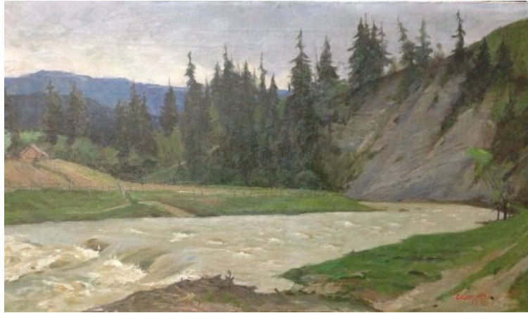
Іл. 1. Г. Чернявський «Річка Прут». 1959. Полотно, олія. 53 x 90 см

Твір 1963 року «Навесні» (іл. 2) суттєво відрізняється від вище зазначеного. В цьому пейзажі майстер писав більш широко із використанням відкритого кольору. Присутні елементи стилізації до більш спростованих геометричних форм, таких як хмари. Використаний в більшій мірі теплий колорит обумовлений сонячною погодою у пейзажі. Комбінуванням широких плям переважно темних та холодних кольорів митець майстерно відобразив крону дерев, її об'єм та світлотінь. А глибину річки – за допомогою пастозного мазку майже відкритого кольору з незначними домішками інших, що виконує функцію віддзеркалення неба на поверхні річки. Цей ефект глибини водою також було досягнуто засобами використання різної товщини шару