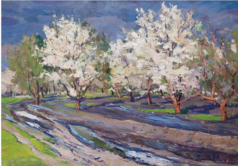
Лл. 6. Г. Чернявський «Яблуни цвітуть». 1970. Полотно, олія. 100 x 80 см

безпосередність сприйняття» [9, с. 219]. Що ми можемо простежити в творчих роботах Г. Чернявського. Це свідчить про відповідність до імпресіонізму, використання принципів та належність творів митця до художньої течії.