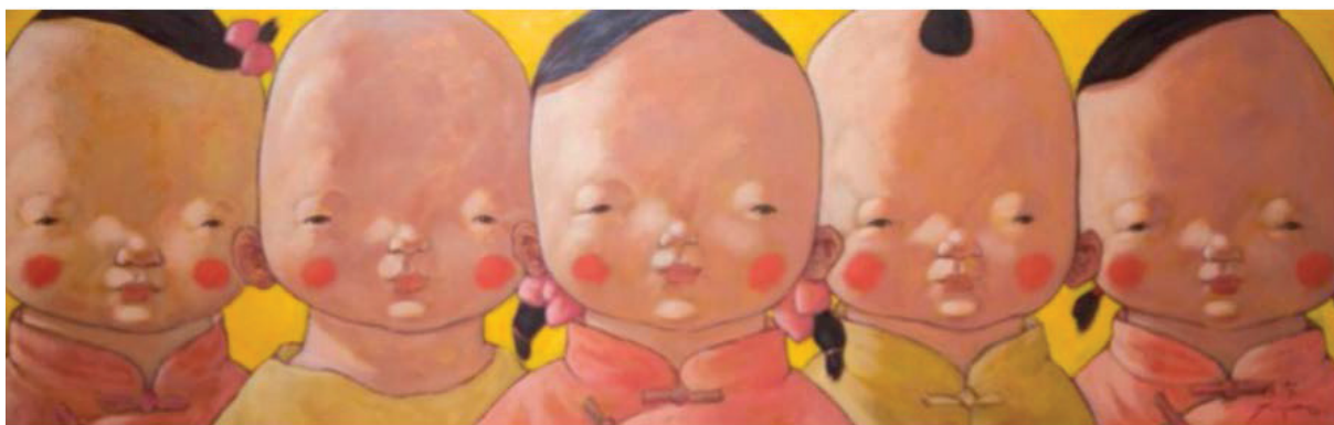
Іл. 3. Сюй Цзе. Діти 5. 2010. Полотно, олія. 50x150. Приватна колекція

Одним з яскравих представників «анімаційного» стилю в станковому живопису Китаю є Сюй Цзе. Художник народився в 1960-х роках у Шанхаї, де навчався на факультеті олійного живопису Академії образотворчого мистецтва (1987–1991). Роботи Сюй Цзе були представлені в багатьох місцях світу, таких як Шанхай, Японія, Корея, Сінгапур і США [6, с.126]. Найвідоміша серія робіт Сюй Цзе – «Діти (Китайські хлопці та дівчата)» нагадує анімаційний серіал та демонструє схожість та єдність людей у світі (іл. 1–3). На більшості картин зображена група дітей, які живуть і насолоджуються простим, тихим і безтурботним життям в ідеалізованій країні «щастя і добробуту». Діти на картинах митця втілюють безпосередність і животворну енергію молодості. Портрети дітей відображають особливий світ дитинства, де кожен момент наповнений дивовижними враженнями та відкриттями. Художник намагається закріпити в своїх творах невловимий момент невинності, радості та допитливості, які є невід’ємними складовими дитячого світу. Дитячі образи відзначаються тим, що художник намагається передати не тільки зовнішню красу, але й внутрішній світ маленьких героїв.