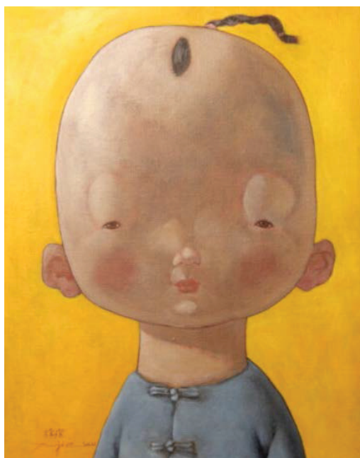
Іл. 1. Сюй Цзе. Діти 1. 2010. Полотно, олія. 50x40. Приватна колекція

динамічні ракурси та перспективи, що додає руху статичним зображенням. Художники все частіше торкаються соціальних і культурних тем, досліджуючи питання ідентичності, технологічного прогресу, урбанізації та екології, часто використовуючи символіку та образи, запозичені з анімації.