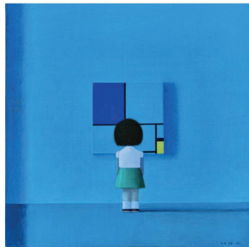
Іл. 11. Лю Є. Композиція з місячним світлом. 2005. Полотно, акрил, олія. 45x45. Приватна колекція

«Композиція з місячним світлом» (іл. 11) пронизана внутрішньою таємницею та багатозначністю, віддає шану творчості видатного нідерландського художника Піта Мондріана (1872–1944), історичному та культурному надбанню західного модерністичного мистецтва. Як і в більшості картин