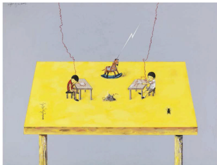
Іл. 5. Лі Цзікай. Кінь, муха і лист. 2005. Полотно, олія. 149,5x189,5. Приватна колекція