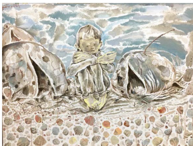
Іл. 7. Лі Цзікай. Оболонка. 2021. Акрил, полотно. 60x80. Приватна колекція

Наприкінці 1990-х Лі Цзікай експериментував із суто формалістичними мазками та композиціями, змінивши олійну техніку на акрил, що надало змогу ширше використовувати елементи національного стилю [3, р. 301]. У серії «Поруч із щастям» (2002) він намалював кілька картин з хлопчиками, які кричали та співали, щоб виплеснути свої емо-