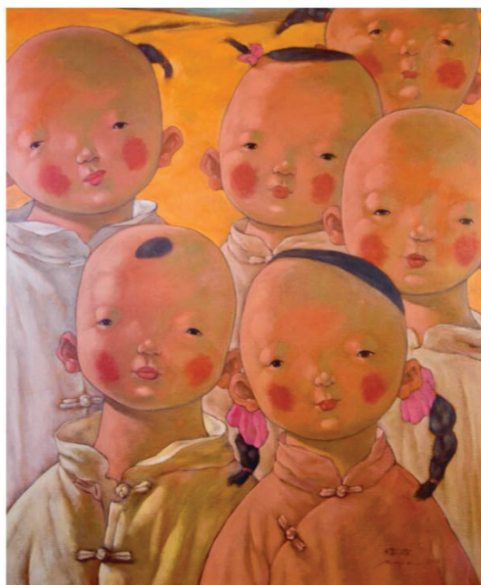
Іл. 2. Сюй Цзе. Діти 2. 2013. Полотно, олія. 115x96. Приватна колекція