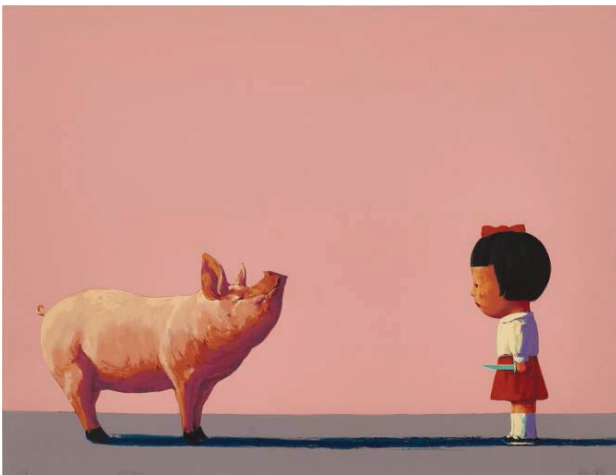
Іл. 10. Лю Є. Убий мене ніжно. 2004. Полотно, олія. 54,7x71,7. Приватна колекція

завіси додає ще один шар значення цьому кольору, символу радості та удачі в китайській культурі. Він був безповоротно перетворений в ідеологічний колір під час Культурної революції в Китаї (1960–1970 і рр.), монополізований комуністичною революційною пропагандою. Лю Є згадував: «Я виріс у світі, який був покритий червоним – червоне сонце, червоний прапор, червоні шарфи – що стало візуальною емблемою мого дитинства...» [4, р. 25]. Майстер використовує силу уяви, дозволяючи новим значенням та асоціаціям як східних, так і західних культурних традицій вільно взаємодіяти з гротескною «анімаційністю». У цьому сенсі серія живописних полотен «Червона завіса» декларує звільнення митця від заангажованості в мистецтві. Символи в його творах багатозначні, сюрреалістичні, а синтетична природа художнього образу спирається на китайське дунхуа, в якому поєднуються гротескність, іронічність, алегоричність.