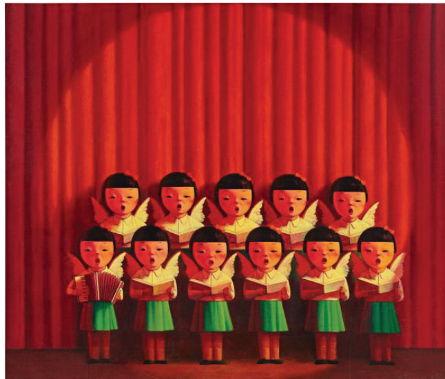
Іл. 9. Лю Є. Хор Ангелів (Червоний). 2004. Полотно, олія. 60x45. Приватна колекція

Лю Є (1964 р.н.) добре відомий в Китаї своїми мрійливими образами дітей (іл. 8–11). Певною мірою Лю Є є піонером китайського