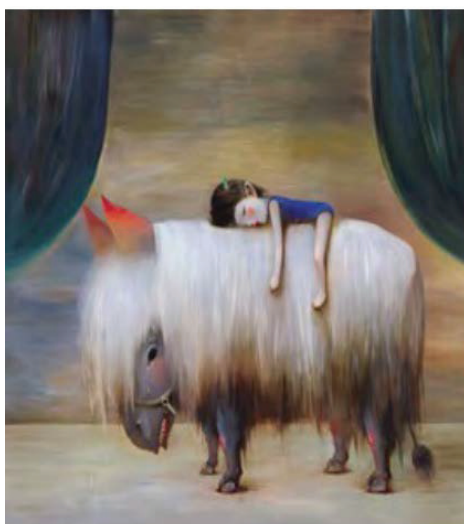
Іл. 4. Лі Цзікай. Гостре лезо. 2004. Полотно, олія. 48x39. Приватна колекція

Як каже Лі Цзікай: «В кожному є образ підлітка, але він більше не може повернутися в минуле... Зображення дітей в анімаційних малюнках є алегорією, сповненою метафор реального світу» [1, с. 171]. Це добре пояснює, чому дитячі зображення митця завжди демонструють смуток, нікчемність, пригніченість, насильство та інші емоції дорослого