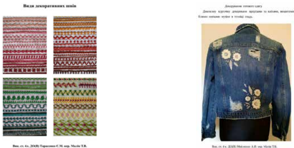
Рис. 7–8. Роботи студентів кафедри дизайну тканин і одягу ХДАДМ. Техніка виконання вишивки та оздоблення готових виробів за допомогою вишивки та мережива. Викл. Т. Малік. 2022–2023 рр.