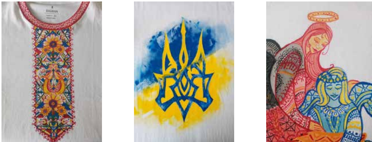
Рис. 4–6. Роботи студентів кафедри дизайну тканин і одягу ХДАДМ. Техніка виконання друку за допомогою трафарету та вільного розпису. Викл. Т. Малік. 2022–2023 рр.

Визначено, що кастомізація – це використання гнучких процесів та організаційних