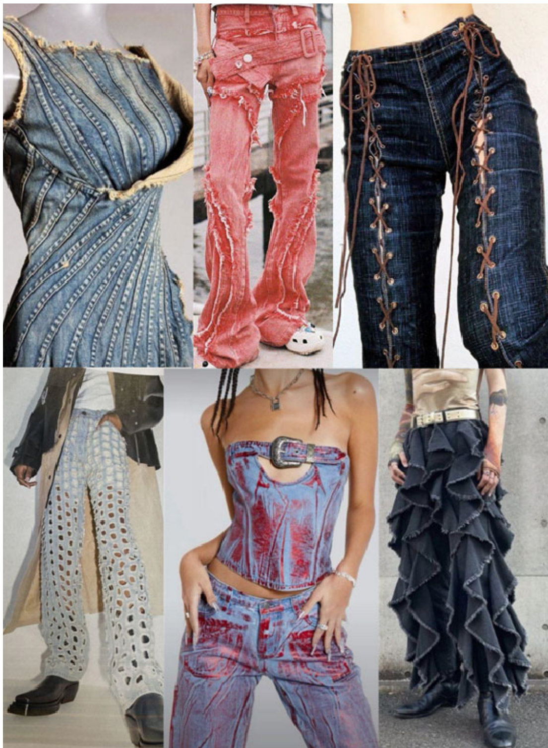
Рис. 1. Способи кастомізації одягу на прикладі джинсових виробів за допомогою рельєфних швів, нашивних деталей, шнурів, лазерної різки, фарбування та воланів

блення, за допомогою цих деталей, створює візуальний ефект руху на поверхні виробу або підкреслює його форму. Має як декоративну, так і практичну функцію через закріплення країв деталей виробу (рис. 5). Доволі популярний метод кастомізації це оздоблення, яке включає в себе використання спеціальних