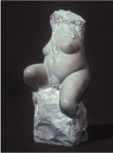
Рис. 3. Корчевий В. «Торс з намисом». Вапняк, 1998 р.

Проте є і торси, які можна виділити в окрему групу, – стилізовані, часто завдяки особливостям роботи з фактурою матеріалу, що збагачує асоціативний ряд, наділені глибинним філософським підтекстом: «Торс довгий» (вапняк, 1998 р.), «Спокій» (вапняк, 1998 р.), «Руйнування» (вапняк, 1994 р.).