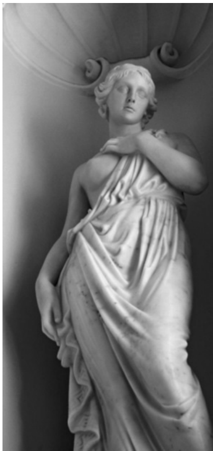
Рис. 1. Корчовий В. «Еврідика». Національна Філармонія України. Мармур, 2014 р.

У творчому доробку майстра є окремий блок торсів, не прив'язаних до певної сюжетки, тобто натурних штудій із різним ступенем натуралістичності, не обійшлося і без стилізації, в якій В. Корчовий теж дуже вправний. І ці торси виконані з тим самим підходом, як і міфологічні персонажі автора, тобто крім додаткових атрибутів, що визначають образ, прив'язка до конкретики персонажа дуже умовна. Так можна сказати, наприклад, про «Жіночий торс» (вапняк, 1997 р.), «Торс» (базальт, 1997 р.), особливо – про «Торс із намистом» (вапняк, 1998 р., рис. 3).